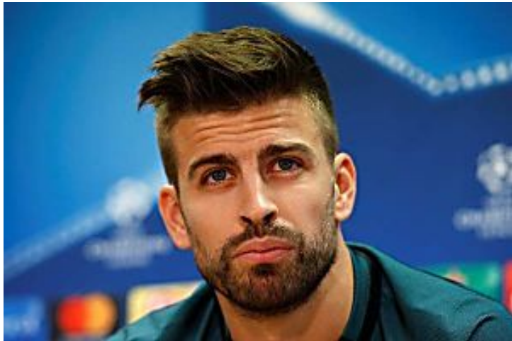
La explosiva reacción de Gerard Piqué en Twitter a la victoria del Barça de penalti en el descuento