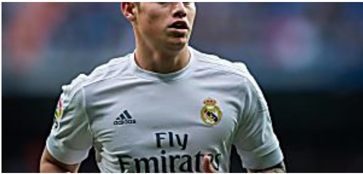
Cinco jugadores que saldrían del Real Madrid la próxima temporada (Rankings de Futbol)