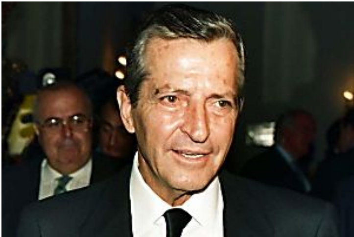
El día en que el avión oficial en el que viajaba Adolfo Suárez se encontró con un OVNI