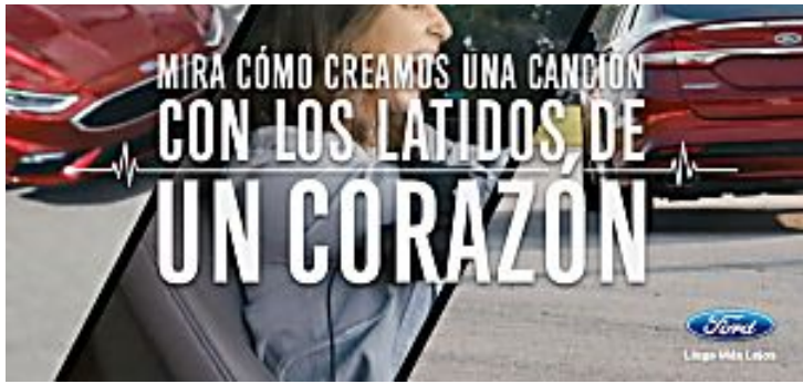
¿Se puede crear una canción con el corazón? (Ford on YouTube)