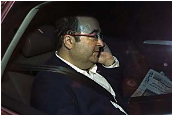
El arma secreta del 'nuevo' PSOE contra Iceta: un 'dossier' elaborado en 2005