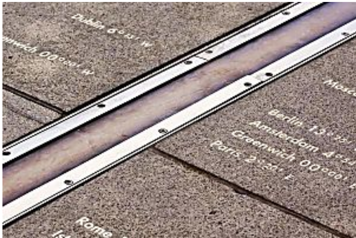
El viejo debate del horario en España: por qué se pide deshacer el cambio que aplicó Franco